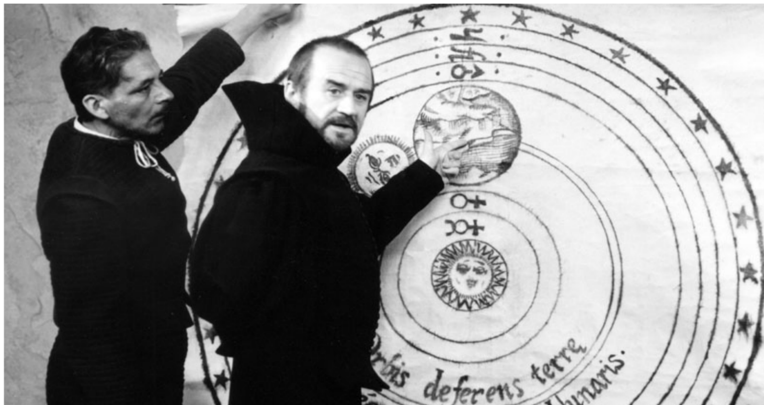
Un fotogramma tratto dal film "Galileo" di Liliana Cavani (1968), proiettato in classe durante una lezione di ambito storico-letterario